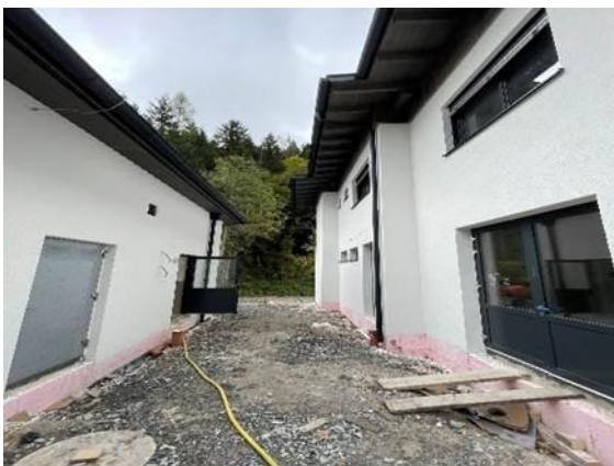
Abb. 5: Neues Betriebsgebäude (rechts) und neues Rechengebäude (links)

Parallel zu den Arbeiten für die neuen Klärbecken erfolgte der Ausbau des neuen Betriebsgebäudes (Verputz, Estrich, Maler- und Fliesenlegerarbeiten, Wärmedämmung und Außenputz), der Umbau des alten Behälters für den frischen Klärschlamm sowie die Verlegung zahlreicher Kabel, Leitungen und Kanäle im gesamten Kläranlagengelände.