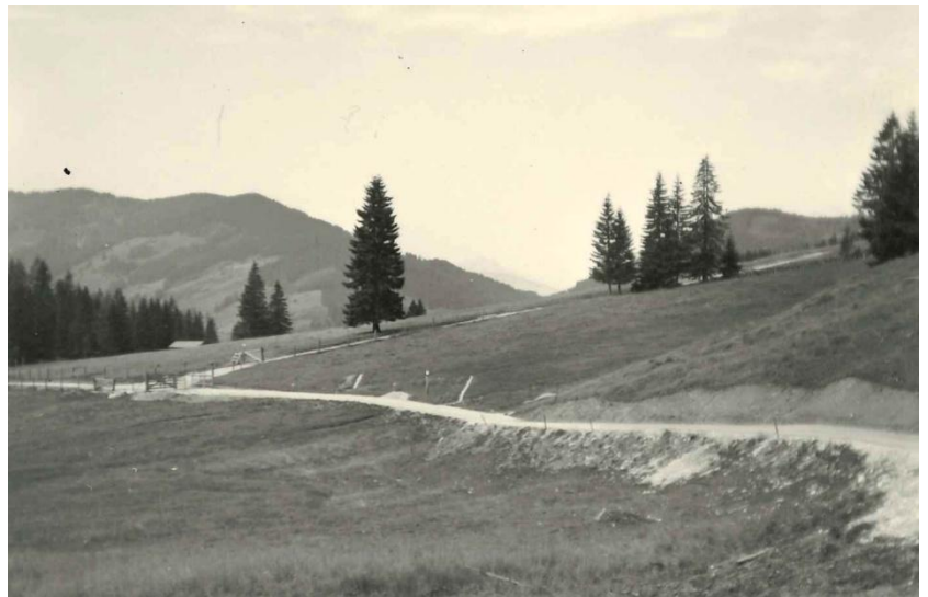
Abb. 3: Die Straße über den Dientner Sattel bei der Zufahrt zur Erichhütte – unterwegs zwischen Dienten und Mühlbach, August 1959.

Hochkönig Straße – Wikipedia ; 16.12.2025 um 10:59 Uhr