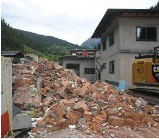
Abb. 1: Abbrucharbeiten beim alten Betriebsgebäude