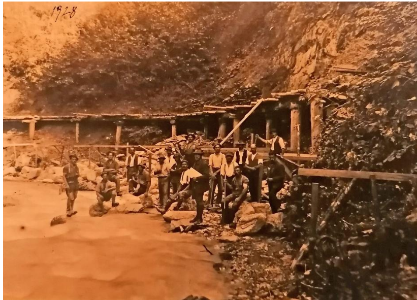
Abb. 1: Das Foto zeigt Straßenbauarbeiten um das Jahr 1928. Arbeiter sind mit einfachen Werkzeugen beim Ausbau der Straße beschäftigt, was die mühsame Handarbeit und die Bauweise jener Zeit widerspiegelt.

Als Partieführer der Wildbachverbauung in Dienten sind in Erinnerung geblieben: der alte Bergknappe Florian Holzlehner , Stockklausner , Hofmann , der im Dientner Graben mit dem Motorrad verunglückte, sowie Kasper und Leitner .