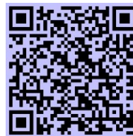
Abbildung -2 Sanierungsförderung vom Land Salzburg