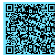
Energieberatung des Landes Salzburg für Privatpersonen

Welche Förderungen gibt es, wenn ich mein Haus dämme oder die Fenster tausche? Wie groß soll ich meine PV-Anlage machen? Auf welche Heizung umsteigen? Private Haushalte können sich kostenlos von der Energieberatung des Landes Salzburg beraten lassen. Infos via 0662/8042 3151, energieberatung@salzburg.gv.at oder www.salzburg.gv.at/energieberatung .