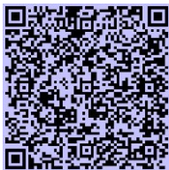
Abbildung -1 Sanierungsoffensive Bund 2023-2024