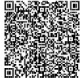
Abbildung 3 Ansuchen um Reparaturbonus für Elektro- und Elektronikgeräte

Machen Sie mit und leisten Sie Ihren aktiven, persönlichen Beitrag zur Abfallvermeidung!