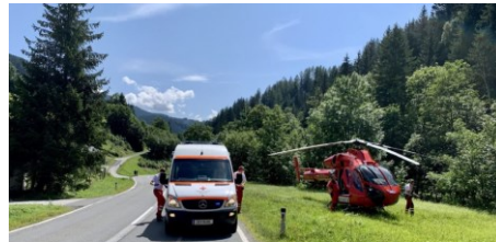
Abbildung 2 Das Rote Kreuz Schwarzach im Einsatz, gemeinsam mit dem Rettungshubschrauber Martin 1 und dem First Responder Dienten